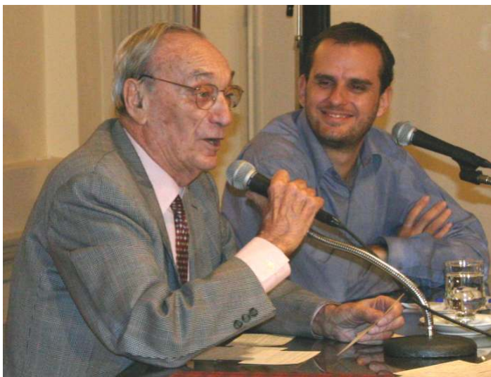
Durante una conferencia en la ciudad Córdoba, en el 2007.

No, yo no podría vivir en Villegas. Me gusta estar con mis amigos, visitar pero yo tengo 60 años en Buenos Aires, tengo a mis hijos y mis nietos aquí, mis libros están aquí, las librerías que quiero, los bares que quiero, ya no podría vivir en Villegas. Puedo estar muy feliz unos días, está mi hermano, los amigos, están los vie-