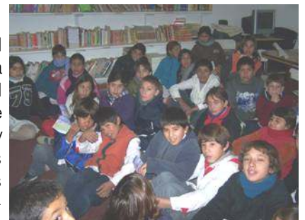
Alumnos de 6° año EPB durante la charla.