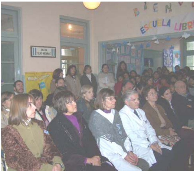
Autoridades y público presente en el acto.