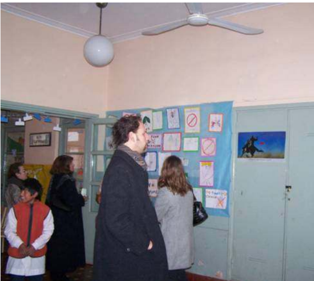
Afiches creados por los chicos.